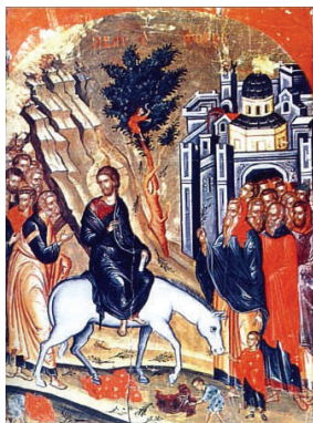
Вход Господень в Иерусалим Икона XVI в. Афон

И когда Он ехал, множество народа вышло навстречу из Иерусалима. Одни снимали с себя одежду и постилали по дороге; другие срезали пальмовые ветви, несли их в руках или бросали по дороге и все громко