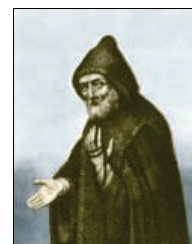
Преподобный Ефрем Сирий

Господи и Владыко живота ..... во веки веков, аминь. (и один земной поклон)