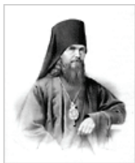
Свт. Феофан Затворник [23 янв., 29 июля н.ст.]

2 Кор. 9, 6-11 ; Лк. 5, 1-11 ). Целую ночь трудились рыбаки и ничего не поймали; но когда Господь вошел в их лодку и, после проповеди, велел забросить мрежу, поймалось столько, что вытащить не могли и мрежа прорвалась. Это образ всякого труда без помощи Божией, и труда с помощью Божией. Пока один человек трудится, и одними своими силами хочет чего достигнуть - все из рук валится; когда приблизится к нему Господь, - откуда потечет добро за добром. В духовно-нравственном отношении невозможность успеха без Господа осязательно видна: "без Мене не можете творить ничесоже", сказал Господь. И этот закон действует во всяком. Как ветка, если не сращена с деревом, не только плода не приносит, но иссыхая и живность теряет, так и люди, если не состоят в живом общении с Господом,