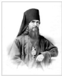
Свт. Феофан Затворник: [23-авг., 29-нояб. и.о.с.]

(1 Тим. 1, 1-7; Лк. 14, 12-15). В указании кого звать на обед или вечерю, позаимствуй себе правило: не делать ничего для ближних в видах воздаяния от них здесь. Но это не значит, что ты будешь тратить понапрасну. В свое время все тебе воздано будет. В нагорной беседе о всех богоугодных делах - молитве, посте, милостыне - Господь заповедал творить их тайно, почему? Потому что Отец Небесный поступающим так воздаст явно. Стало быть, всеми трудами жизни своей христианин должен заготавливать себе будущее блаженство, строить себе вечный дом и предпосылать туда провиант на всю вечность. Такой образ