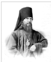
Свт. Феофан Затворник [23 янв., 29 окт. в год]

Сретение. В Сретении Господа окружают, с одной стороны, праведность, чающая спасение не в себе, - Симеон, и строгая в посте и молитвах жизнь, оживляемая верою, - Анна; с другой - чистота существенная, всесторонняя и непоколебимая - Дева Богоматерь, и смиренная, молчаливая покорность и преданность воле Божией - Иосиф Обручник. Перенеси все эти духовные настроения в сердце свое и встретишь Господа не приносимого, а Самого грядущего к тебе, воспримешь Его в объятия сердца, и воспоешь песнь, которая пройдет небеса и возвеселит всех ангелов и святых.