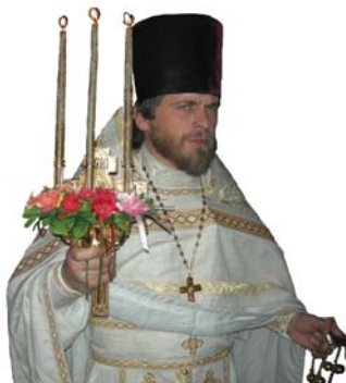
Пасха Христова 2009 г. Мюнхен.