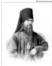
Свт. Феофан Затворник: [23 янв., 29-август и сеп.]

Пасха, Господня Пасха! От смерти к жизни привел нас Господь Своим Воскресением. И вот Воскресение это "ангелы поют на небеси". увидев светлость обоженного естества человеческого в предопределенной ему славе, в лице Господа Искупителя, во образе коего, силою Воскресения Его, имели претвориться все истинно верующие в Него и прилепляющиеся к Нему вседушно. Слава Господи, преславному Воскресению Твоему! Ангелы поют, сорадуясь нам и предзря восполнение сонма своего; нас же сподоби, Господи, Тебя Воскресшего чистым сердцем славить, видя в Воскресении Твоем пресечение снедающего нас тления, засеменение новой жизни пресветлой и зарю будущей вечной славы, в которую Предтечею вошел Ты Воскресением нас ради. Не человеческие только, но вместе и ангельские языки не сильны изъяснить неизреченную Твою к нам милость, преславно Воскресший Господи!