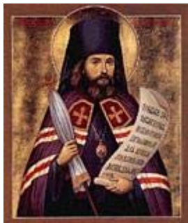
святитель Иоанн(Максимович) Шанхайский и Сан- Францисский чудотворц.