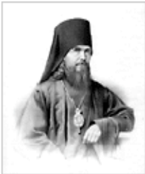
Свт. Феофан Затворник (23 янв., 29-голет д.ст.)

(2 Кор. 11, 31-12, 9; Лк. 6, 31-36). Коренная, исходная заповедь - люби. Малое слово, а выражает всеобъемлющее дело. Легко сказать люби, но не легко достигнуть в должную меру любви. Не совсем ясно и то, как этого достигнуть; потому-то Спаситель обставляет эту заповедь другими