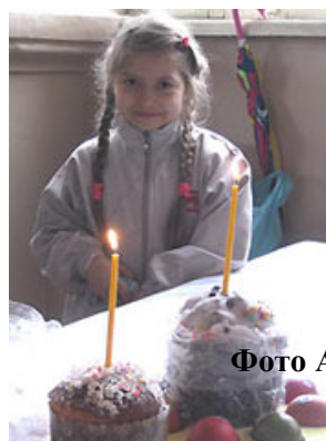
Радость ожидания