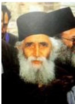
Старец Паисий Святогорец