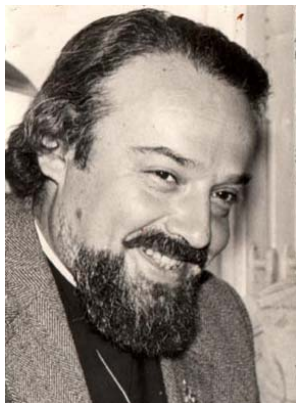
ФОТОГРАФИИ ВИКТОРА АНДРЕЕВА

Доброе дело - молитва с постом и милостыней и справедливостью (Тов 12;8)