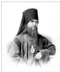
Свт. Феофан Затворник: [23 лет, 29 лет и 10 лет]

(Иуд. 1, 1-10; Лк. 22, 39-42, 45-23, 1). Сретение. В Сретении Господа окружают, с одной стороны, праведность, чающая спасение не в себе, - Симеон, и строгая в посте и молитвах жизнь, оживляемая верою, - Анна; с другой - чистота существенная, всесторонняя и непоколебимая - Дева Богоматерь, и смиренная, молчаливая покорность и преданность воле Божией - Иосиф Обручник. Перенеси все эти духовные настроения в сердце свое и встретишь Господа не приносимого, а Самого грядущего к тебе, воспримешь Его в объятия сердца, и воспоешь песнь, которая пройдет небеса и возвеселит всех ангелов и святых.