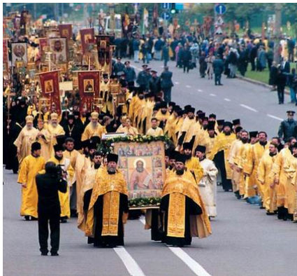
Перенесение мощей прав. Алексия Московского