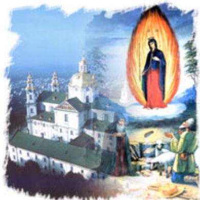
Свято-Успенская Почаевская Лавра

Журнал Московский Патриархии, № 1, 1997 г.