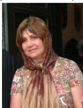
Нина Карл Кемптенский приход.