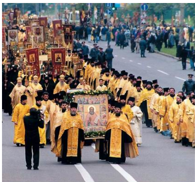
Перенесение мощей прав. Алексия Московского