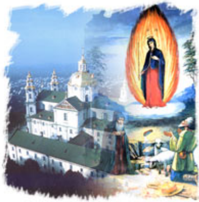
Свято-Успенская Почаевская Лавра