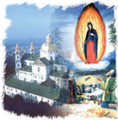
Свято-Успенская Почаевская Лавра