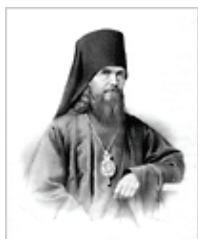
Свт. Феофан Затворник [23 янв., 29 июля н.ст.]

( Дея. 2, 1-11 ; Ин. 7, 37-52 ; 8, 12 ). Совершилась экономия нашего спасения! Действия всех Лиц Пресвятой Троицы в сем деле отныне вступили в силу. Чему быть благоволил Бог-Отец, что исполнил в Себе Сын Божий, то присвоить верующим снишел ныне Дух Святой. Ибо спасение наше "по предведению Бога Отца, при освящении от Духа, к послушанию и окроплению Кровью Иисуса Христа" ( 1 Пет. 1, 2 ). Того ради и "крещаемся во имя Отца и Сына и Святого Духа", обязуясь "соблюдать все, что Я повелел вам" ( Мф. 28, 19-20 ). Не исповедующие Пресвятой Троицы не могут иметь части в спасительных действиях Лиц Ее и, следовательно, получить спасение. Слава Отцу и Сыну и Святому Духу, Троице единосущной и нераздельной, предавшей нам исповедание о Себе! "Отче Вседержителю, Слове и Душе, тремя соединяемое во Ипостасех естество пресущественно, и пребожественно, в Тебя крестились, и Тебя благословим во все веки".