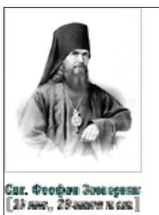
Свт. Феофан Затворник (23 янв., 29-август в год)

( 1 Пет. 2, 21-3, 9 ; Мк. 12, 13-17 ). Ныне Апостол указывает нам на "сокровенного сердца человека", как предмет самых тщательных забот и попечений наших. Его в себе образованием надлежит нам благоукрашать себя. Что же это за потаенный сердца человек? Тот человек, который в сердце воображается, когда в нем водворятся все добрые расположения и чувства. Пересмотри эти расположения и чувства и увидишь лик сокровенного в сердце человека. Вот эти расположения! "От Божественной силы Его даровано нам все потребное для жизни и благочестия" и с своей стороны "прилагая к сему все старание", пишет Св. Петр, "покажите в вере вашей добродетель, в добродетели рассудительность, в рассудительности воздержание, в воздержании терпение, в терпении благочестие, в благочестии братолюбие, в братолюбии любовь" ( 2 Пет. 1, 5-7 ). Подобно этому перечисляет внутренние добрые расположения сердца христианского и Св. Павел: "Плод же духа: любовь, радость, мир, долготерпение, благость, милосердие, вера, кротость, воздержание" ( Гал. 5, 22-23 ). И еще: "Облекитесь, избранные Божии, святые и возлюбленные, в милосердие, благость, смиренномудрие, кротость, долготерпение. . . более же всего облекитесь в любовь, которая есть совокупность совершенства, и да владычествует в сердцах ваших мир Божий" ( Кол. 3, 12-15 ). Сложи из всех этих доброт, как из членов, одно тело духовное, - и будешь иметь благолепный лик сокровенного сердца человека, - подобный которому и поревнуй водворить в сердце своем.