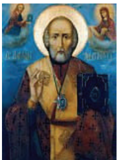
Местночтимая икона Св. Николая Чудотворца (Екатеринбург)