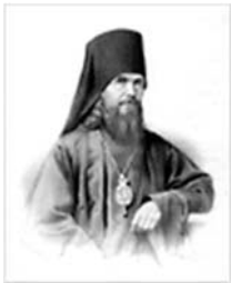
Свт. Феофан Затворник [23 янв., 29 июня н.ст.]