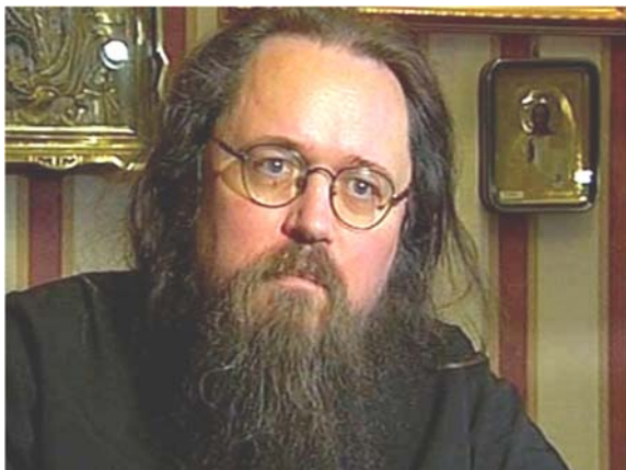
диакон Андрей Кураев

– Отец Андрей, сейчас идет Петров пост, который еще называют апостольским, но при этом считают не таким строгим и важным, как Великий. Может, стоит напомнить о его сути? Как постились апостолы, и чем их пример для нас полезен?