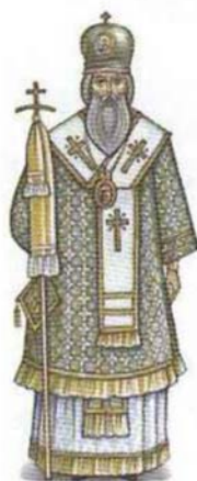
у архиерея — омофóр