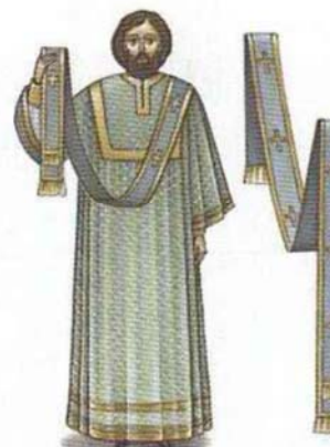
у диакона — орáрь