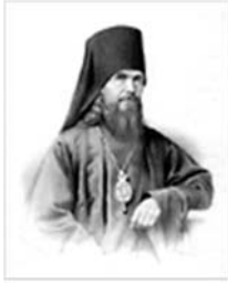
Свт. Феофан Затворник [23 янв., 29 июня н.ст.]

( Дея. 1, 1-12 ; Лк. 24, 36-53 ). Силу Вознесения Господня св. Павел выражает так: "восшел на высоту, пленил плен и дал дары человекам" ( Еф. 4, 8 ). Удовлетворив правде Божией, Господь отверз для нас все сокровища благодати Божией. Это и есть плен, или добыча вследствие победы. Начало раздаяния этой добычи человекам есть сошествие Святого Духа, Который, сошедши единожды, всегда пребывает в Церкви и каждому подает что кому потребно, беря все из того же единожды плененного плена. Приди всякий и бери. Но заготовь сокровище-хранительницу - чистое сердце; имей руки, чем брать - веру неразмышляющую, и приступи исканием уповаящим и неотступно молящимся.