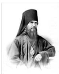
Свт. Феофан Затворник [23 янв., 29 июня н.ст.]

(Гал. 4, 4-7; Мф. 2, 1-12). Слава Тебе, Господи! И еще дождались мы светлых дней Рождества Христова: повеселимся же теперь и порадуемся. Св. Церковь нарочно для того, чтоб возвысить наше веселие в эти дни, учредила перед ними пост - некоторое стеснение, чтобы вступая в них мы чувствовали себя как бы исходящими на свободу. При всем том она никак не хочет, чтобы мы предавались услаждению только чувств и одним удовольствиям плотским. Но исстари, наименовав эти дни святками, требует, чтобы самое веселие наше в течение их было свято, как они святы. А чтобы не забылся кто веселясь, она вложила в уста нам краткую песнь во славу родившегося Христа, которою остепеняет плоть и возвышает дух, указывая ему достойные дней этих занятия: "Христос рождается - славите" и проч. Славьте же Христа, и славьте