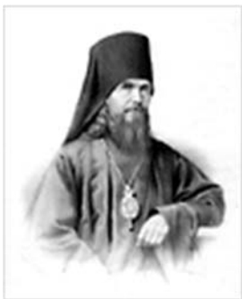
Свт. Феофан Затворник [23 янв., 29 июня н.ст.]

(Лк. 4, 16-22). Господь не возвестить только пришел о лете приятном, но и принес его. Где же оно? В душах верующих. Земля никогда не будет превращена в рай, пока будет существовать настоящий порядок вещей; но она есть и будет поприщем приготовления к райской жизни. Начатки ее полагаются в душе; возможность сему в благодати Божией; благодать же принес Господь наш Иисус Христос - принес, следовательно, для душ лето приятное. Кто слушает Господа и исполняет все заповеданное Им, тот получает благодать и силою ее наслаждается в себе летом приятным.