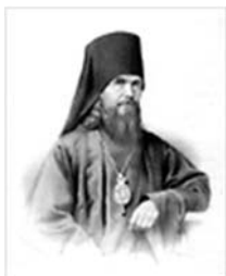
Свт. Феофан Затворник [23 янв., 29 июня н.ст.]

"Иже щадит жезл свой, ненавидит сына: любяй же наказует прилежно " ( Прит. 13, 25 ). Оставим детей и займемся собою. В отношении к каждому это значит вот что: не щади себя, прилежно наказывай. Саможаление - корень всех наших поползновений на грех. Кто же не снисходит себе, тот всегда тверд в добре. Больше всего держать надо в самой строгой дисциплине плоть, эту рабу несмысленную. Когда томят ее, она смиренна; а дай ей только малую льготу, уж она начинает показывать когти и свирепеть очами любострастными. Но дивно то, что, хоть не говори, все стоят за плоть и всякие ей выдумывают угоды. Даже наука будто бы без этого нейдет. Что же это должно быть за наука такая?